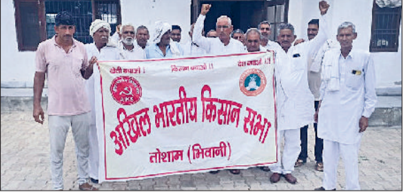
भिवानी। बैठक के दौरान नारेबाजी करते अखिल भारतीय किसान सभा के पदाधिकारी व सदस्य।

शहर में अंतरराष्ट्रीय कृष्ण भवनामृत संघ के तत्वावधान में भगवान जगन्नाथ की रथयात्रा निकाली गई तथा यात्रा के दौरान शहर में लोगों को प्रसाद वितरित किया। रथयात्रा में लोगों ने भगवान जगन्नाथ का रथ खींचा और हरे रामा, हरे कृष्णा कृष्णा के जयघोष से शहर गुंजायमान हो गया।