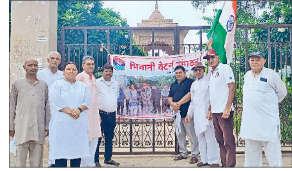
भिवानी। विरोध प्रदर्शन करते वेटेरन संगठन के पदाधिकारी व सदस्य।

हर साल मानसून से पहले पानी निकासी पर लाखों रुपये खर्च करने के बाद भी समस्या ज्यों की त्यों बनी रहती है तय की जाए अधिकारी-कर्मचारियों की जवाबदेही