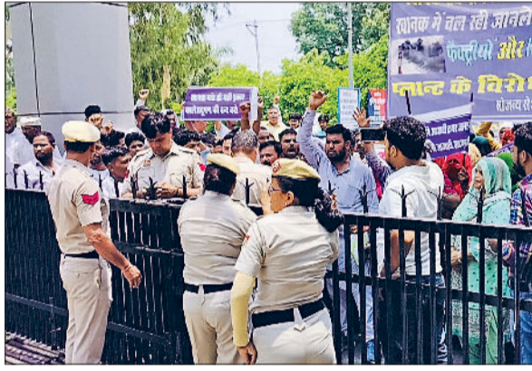
भिवानी। उपायुक्त कार्यालय के बाहर प्रदर्शनकारियों को रोकती पुलिस व रिहायशी क्षेत्र में अवैध फैक्ट्री बंद करवाने की मांग को लेकर नारेबाजी करते हुए।

इस मामले को लेकर सीएम नायाब सैनी से भी मुलाकात की जाएगी। चूंकि टॉयर जलाए जाने से इलाके में जबरदस्त पर्यावरण प्रदूषण हो रहा है। जिसका सीधा असर ग्रामीणों की सेहत पर बुरा असर पड़ रहा है। शुक्रवार को गांव खानक के अनेक ग्रामीण उपायुक्त कार्यालय पहुंचे। ग्रामीणों ने क्षेत्र में चल रही पुराने टॉयर जलाने की फैक्ट्री