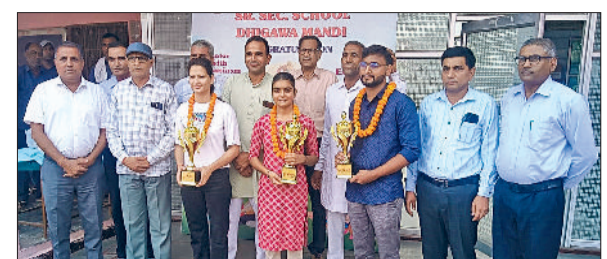
डिगावा मंडी। नीट में पास हुए विद्यार्थियों को सम्मानित करते हुए स्कूल मेनेजमेंट टीम।

डिगावा मंडी के जीनियस स्कूल में प्रतिभा सम्मान समारोह आयोजित